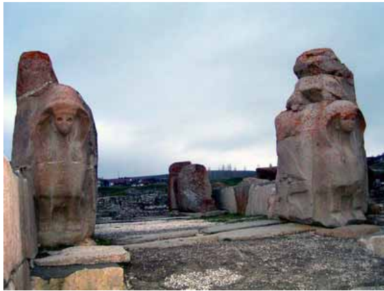
Alacahöyük Hitit İmparatorluk Dönemi Kent Kapısı. Kapının sağ ve solunda iki adet Sfenks yer almaktadır. Sfenksler aslan vücutlu kadın başlı mitolojik yaratıklardır.