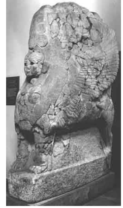
Sfenksli Kapı'da bulunan Sfenks heykeli çiftinden biri. Şu anda Berlin Müzesinde.