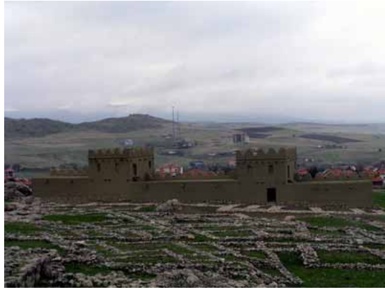
Hattuşaş. Büyük Tapınaktan aslına uygun olarak yeniden yapılmış Hitit surlarının görünüşü.