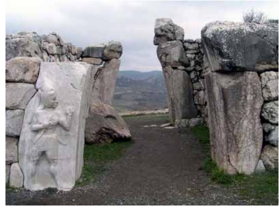
Hattuşaş Kral Kapısı. Kapının şehre bakan tarafında elinde baltası ile bir Hitit tanrısı betimlenmiştir.