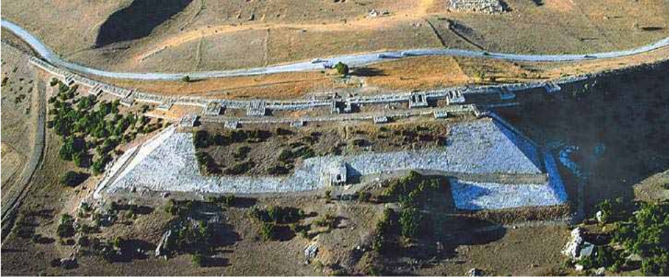
Hattuşaş şehri anıtsal kale kapısının (Yerkapı) hava fotoğrafı.