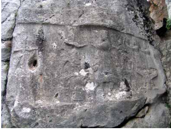
Hattuşaş Yazılıkaya. Tanrılar grubu ile tanrıçalar grubunun karşılaşması.