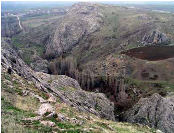
Hattuşaş. Büyük Kale'nin arkasında kalan muhteşem boğaz. Boğazın içinden bir dere akmaktadır. Hititler zamanında bu boğazın üzerinde bir köprü yapılmıştı.