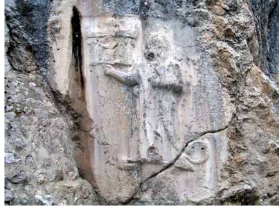
Hattuşaş Yazılıkaya. IV. Tudhaliya kabartması. Sol üst köşede hieroglif olarak kralın ismi yazılıdır.