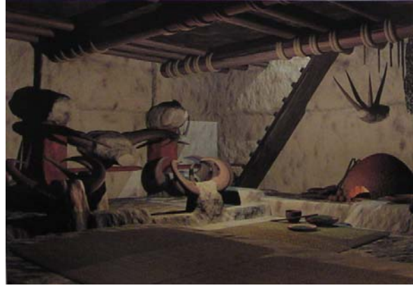
Çatalhöyük evinin iç yapısı.