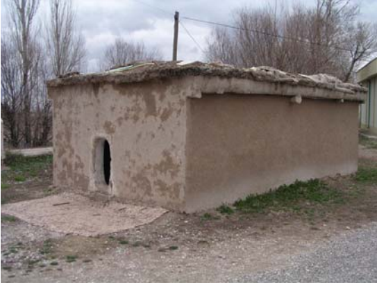
Kazı ekibi tarafından yapılmış Çatalhöyük evi.