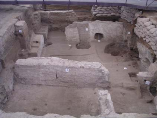
1993'te başlayan ikinci kazılarda ortaya çıkarılmış Çatalhöyük evine ait kalıntılar.