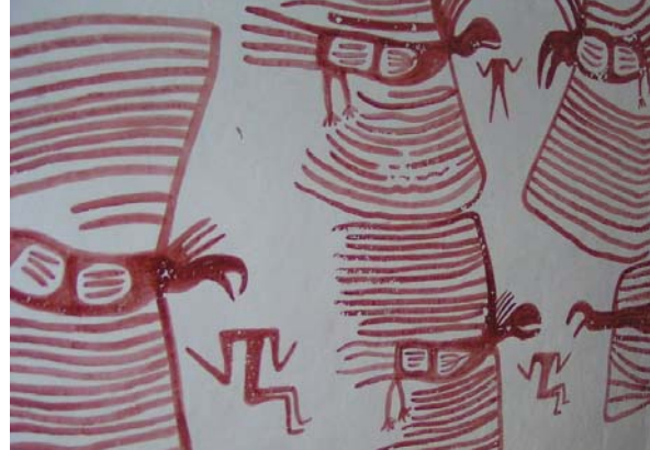
Çatalhöyüklülerin ilginç ölü gömme törenlerini gösterir duvar resmi. Ölülerin etleri akbabalara yediriliyor.