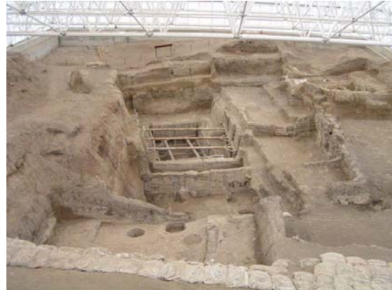
1961 yılında başlanan ilk kazılarda açılan bölüm. Bu açmada 14 yapı katı tespit edilmişti.